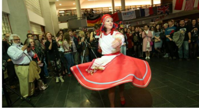
Une soirée pour souhaiter la bienvenue aux étudiants internationaux.

L'Université de Franche-Comté accueille plus de 2 000 étudiants internationaux chaque année. Parmi eux, 130 étudiants en moyenne effectuent une mobilité dans le cadre d'un programme d'échange, fruit d'une coopération entre universités permettant une expérience à l'étranger tout en poursuivant sa scolarité dans l'établissement d'origine. L'ESN Besançon, l'association des étudiants internationaux, organise ce jeudi la 8e édition de la Nuit des étudiants du monde, une soirée culturelle et festive mettant à l'honneur la diversité étudiante.