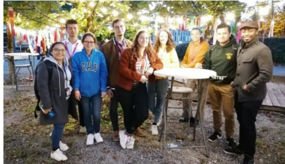
Les étudiants internationaux et ESN Besançon sont heureux de se retrouver pour démarrer l'année universitaire.