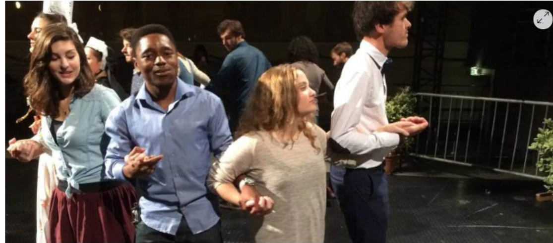
Initiation à la danse bretonne pour la Nuit des étudiants du monde.

Après une année 2020 marquée par le contexte sanitaire lié à la pandémie de Covid-19, la Nuit des étudiants du monde fait son retour en 2021. Objectif : accueillir les étudiants internationaux dans les campus français. À Brest (Finistère), rendez-vous est donné le 16 décembre 2021.