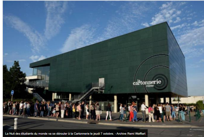
La Nuit des étudiants du monde va se dérouler à la Cartonnerie le jeudi 7 octobre.

Mis en ligne le 29/09/2021 à 17:11 Aurélie Beaussart