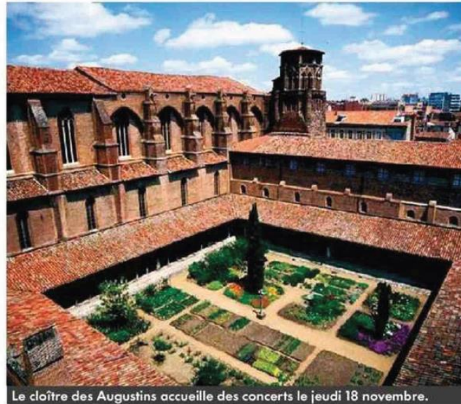
Le cloître des Augustins accueille des concerts le jeudi 18 novembre.

La Semaine de l'étudiant , prépare sa 16 e édition du 13 au 18 novembre. Le festival a pour but de favoriser l'intégration des nouveaux étudiants toulousains. Quatre événements se tiendront en quatre jours. Samedi 13 novembre, la cour du Crous et de l'Ensav, rue du Taur, accueille les associations étudiantes toulousaines avec au programme ateliers, jeux et à partir de 18h une scène dédiée aux étudiants artistes. Le lendemain, dimanche 14, une course d'orientation est organisée à travers Toulouse pour découvrir la ville, avec deux parcours «sportif» et «chill», accessibles gratuitement sur inscription. Le mardi 16 novembre ce sera la nuit des étudiants du monde, pour souhaiter la bienvenue aux 10 000 étudiants internationaux toulousains, et le 18 une soirée Arts et Culture dans le cadre exceptionnel du cloître des Augustins. welcomedesk.univ-toulouse.fr