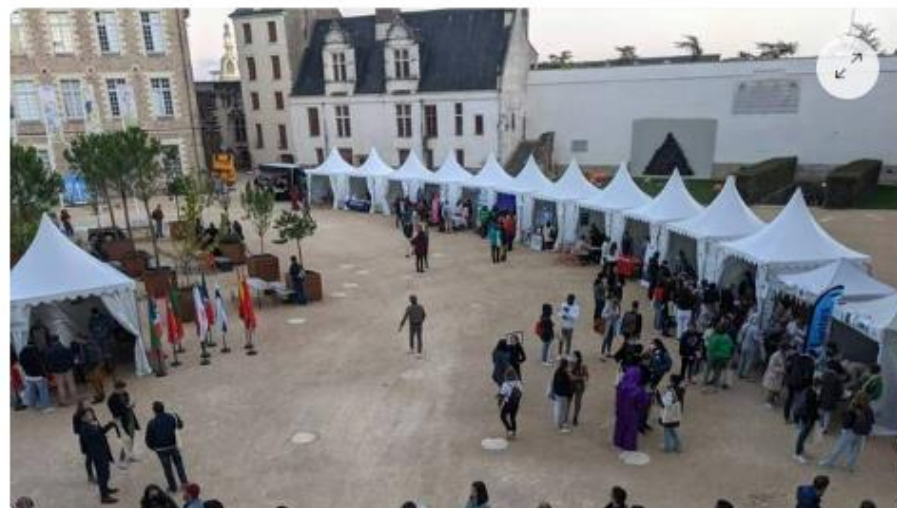
La dernière Nuit des étudiants nantaise a eu lieu le 8 octobre 2021.

Une soirée festive pour les étudiants étrangers. La Ville de Nantes participe à la prochaine Nuit des étudiants du monde qui aura lieu ce mercredi 5 octobre au château des ducs. Au programme : concert, DJ sets, village associatif, visites multilingues du musée, food truck... Initiée par la Ville de Lyon en 2022, la Nuit des étudiants du monde s'est déployée sur toute la France à partir de 2012 sous l'impulsion de l'association des villes universitaires de France (AVUF) et d'Erasmus Student Network France.