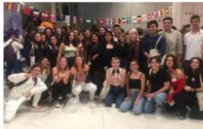
Un groupe d'étudiants pendant la nuit des étudiants du monde organisée par l'association "Sortie d'amphi".

" J'appelle Pastré ", lance au micro l'animatrice face à la centaine d'étudiants rassemblés jeudi dernier au milieu de l'espace Bargemon pour la nuit des étudiants du monde. Une jeune fille asiatique fend la foule. C'est l'inscription du badge qui lui a été remis à l'entrée qui vient d'être désignée. Gagnante de deux places pour un spectacle à la Criée elle saisit son butin et rejoint ses copains.