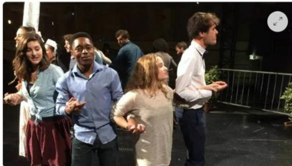
Initiation à la danse bretonne lors d'une Nuit des étudiants du monde.

Galettes, crêpes, danses et musiques bretonnes, mais aussi pom-pom girls ou danses orientales... À Brest (Finistère) , la huitième Nuits des étudiants du monde se déroulera à l'Atelier des Capucins le jeudi 15 décembre 2022, de 19 h à 00 h 30.