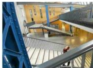
L'événement se déroulera aux Capucins, à la mi-décembre. Il sera gratuit.

Le programme de la Nuit des étudiantes et étudiants du monde 2022 à Brest, le jeudi 15 décembre, de 19 h à 0 h 30 nuitdesetudiantsdumonde.org/brest2022/ (entrée gratuite)