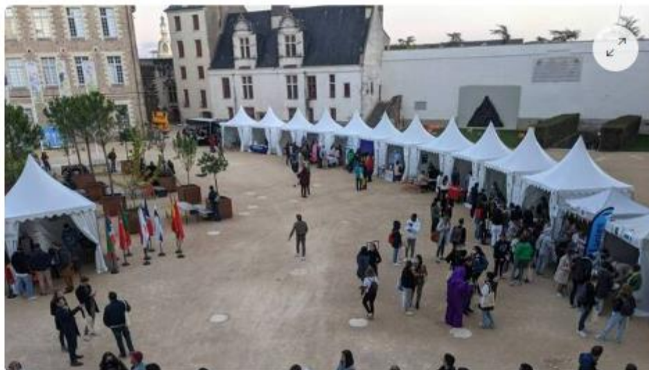
La dernière Nuit des étudiants nantaise a eu lieu le 6 octobre 2021.

Une soirée festive pour les étudiants étrangers. La Ville de Nantes participe à la prochaine Nuit des étudiants du monde qui aura lieu ce mercredi 5 octobre au château des ducs. Au programme : concert, DJ sets, village associatif, visites multilingues du musée, food truck... Initiée par la Ville de Lyon en 2022, la Nuit des étudiants du monde s'est déployée sur toute la France à partir de 2012 sous l'impulsion de l'association des villes universitaires de France (AVUF) et d'Erasmus Student Network France.