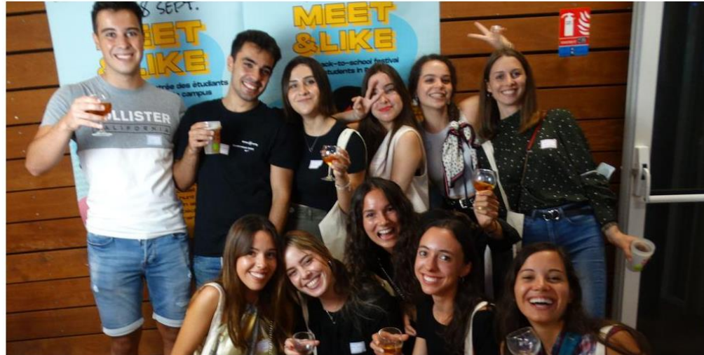
Des étudiants internationaux au festival l'an passé.

Par SudOuest.fr Publié le 14/09/2022 à 17h52