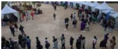
La dernière Nuit des étudiants nantaise a eu lieu le 6 octobre 2021.

Nous sommes convaincus que ces événements participent à l'attractivité de la France auprès des jeunes étrangers. La crise sanitaire a souligné le besoin impérieux pour les étudiants internationaux de créer du lien social, au risque de souffrir d'isolement. Nous devons renforcer cette démarche de bienvenue afin qu'ils gardent un souvenir positif de leurs expériences de mobilité en France, explique Catherine Vautrin, Présidente de l'Avuf.