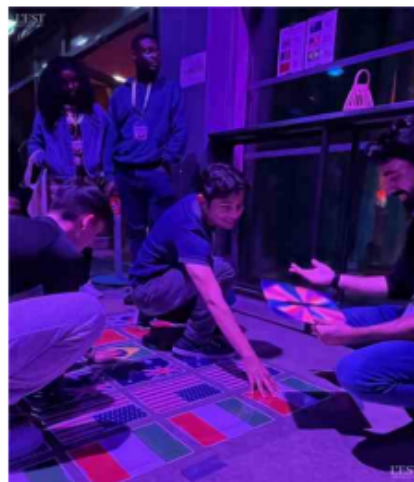
La soirée a eu lieu à la Rodia.

l'explique « J'aime tout. Il y a plein de gens et beaucoup de pays différents, de nouveaux arrivants... C'est un joli mélange de personnes, une belle diversité ».