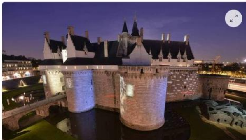
Cette année, la Nuit des étudiants se déroule au château des ducs de Bretagne.

« Le mouvement Nuit des étudiants ne cesse de s'amplifier depuis ses débuts en 2002. Née à Lyon, l'initiative se décline aujourd'hui dans vingt-deux villes et devrait toucher plus de 15 000 participants de 50 nationalités différentes », expose Catherine Vautrin, présidente de l'Association des villes universitaires de France.