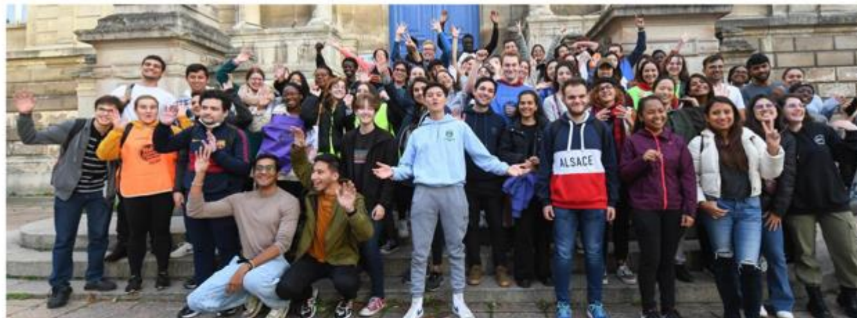
La Nuit des étudiants du monde permet aux étudiants étrangers de se familiariser avec la ville et ses services.