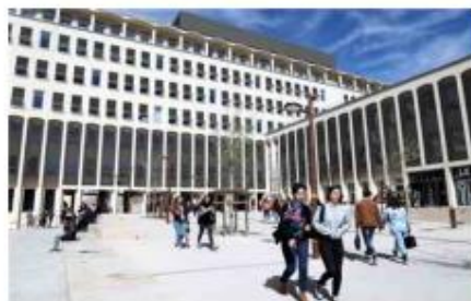
Les étudiants internationaux de plus en plus nombreux en France, notamment dans le sud.

Ainsi, elle inclut désormais la possibilité de coupler l'évènement nocturne à un évènement diurne, et peut être organisée en début de second semestre. Cette version renouvelée de la charte a fait l'objet d'une signature solennelle réunissant l'ensemble des partenaires le 21 septembre 2022.