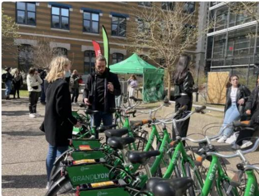
Les freevelo'v sont prêtés aux étudiants boursiers pour une période de 3, 6, 9 mois ou un an.